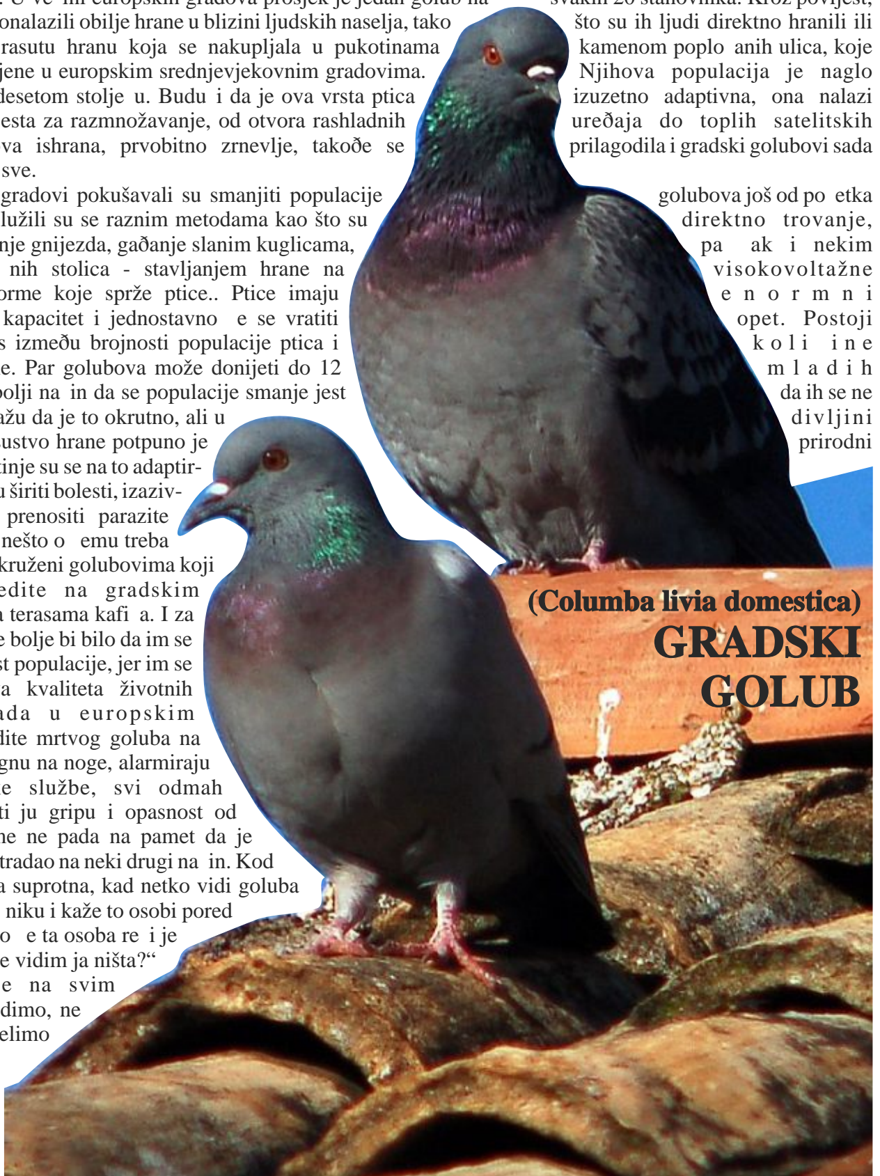
( Columba livia domestica ) GRADSKI GOLUB