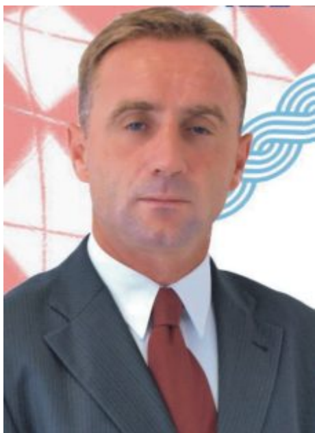
Ministar prometa, veza, turizma i zaštite okoliša u Vladi Županije Posavske

- Gospodine ministre, možete li nam reći i Vaše viđenje trenutnog stanja zaštite okoliša u Županiji Posavskoj?